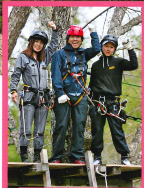
水上高原フォレストジップライン

運動オンチでも全く問題なし! 慣れればいろんなポーズを決められるそうだが、両手を離すので精いっぱい。